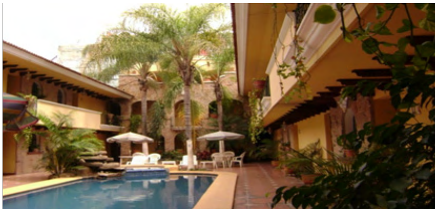
Hotel Villas Zapotlán Federico del Toro No. 61 Ciudad Guzmán, Jalisco