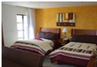
Hotel Victoria – Plaza Victoria s/n Lagos de Morenos, Jalisco.