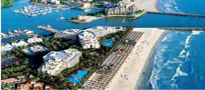
Hotel Paradise Village Av. Paseo de los Cocoteros #1, Nuevo Vallarta 63732