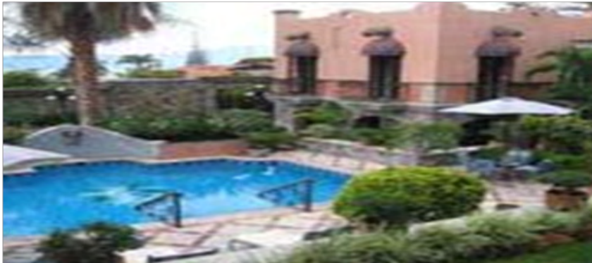
Hotel Real de Chapala Paseo del Prado # 20 y Paseo de las Brisas, Chapala