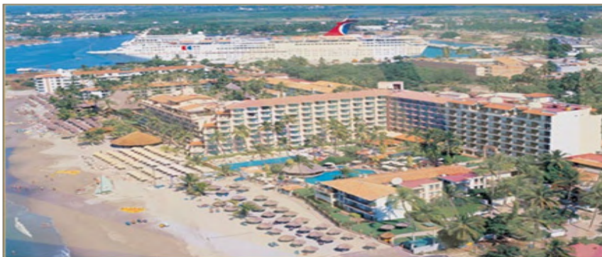
Hotel Crown Paradise Club De Las Garzas zona hotelera Norte 3, 48333 Puerto Vallarta