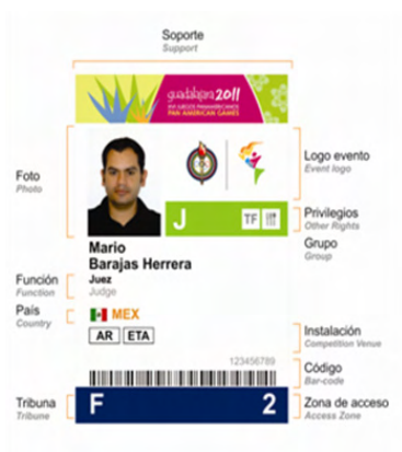
Cédula de Identidad Panamericana

Para que el área de Acreditación del COPAG esté en posibilidades de entregar y activar las Cédulas de Identidad Panamericana, los Oficiales de Competencia deberán de estar registrados en el sistema de inscripciones, mostrar una identificación oficial y su Carta de Invitación.