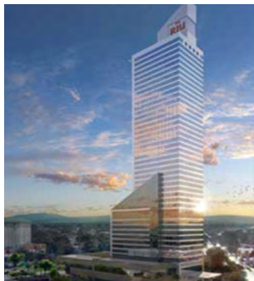
HOTEL RIU Av. López Mateos #830 Fracc. Chapalita, Guadalajara, Jal.

2. El Hotel Best Western Plaza Génova se encuentra ubicado en pleno Centro de la ciudad, a 20 kilómetros del Aeropuerto y muy cerca de monumentos históricos como la Catedral, el Hospicio Cabañas, la Plaza de la Liberación, el Teatro Degollado y el Mercado de San Juan de Dios.