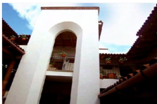
Hotel La Casona – Capullín No.54 Tapalpa, Jalisco